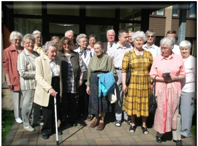
Ausflug nach Horn im Mai 2006

genannt werden, die 100 Jahre LKG Bad Salzuflen mitprägten. Rücken wir ab von den großen Veranstaltungen, dann sehen wir die vielen Kleinarbeiten in Vorbereitungen, z.B. „Weihnachten im Schuhkarton“, Ausflüge, Gestaltung des Schaukastens und des Infoblattes „Gemeinschaftsbrief“, Einladungen gestalten, drucken, verteilen. Fußgängerzonen- und Schuleinsätze, Plakatieren von Schau-fenstern; Zeitungsberichte schreiben und mit diversen Medien Kontakte pflegen. Geburtstagsgrüße schreiben, ebenso wichtig wie das Begleiten von Menschen in Einsamkeit, Not und Krankheit.