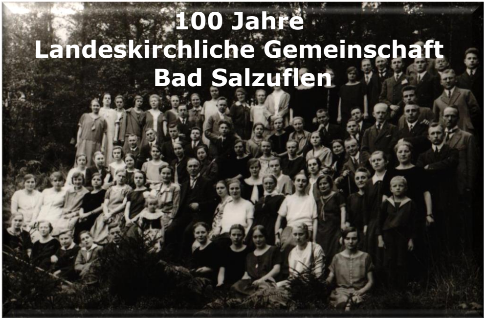
"Picknick im Grünen" um ca. 1949